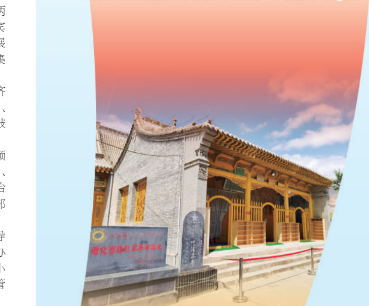
图②：循化西路红军革命旧址。