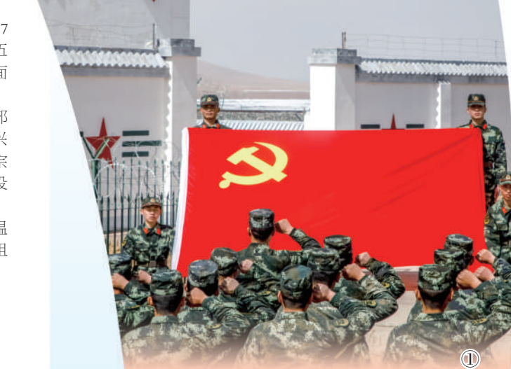
图①：武警青海总队执勤支队官兵开展主题党日活动。