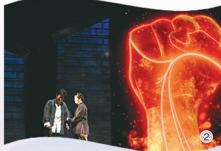
② 史诗剧《红色李巷》剧照