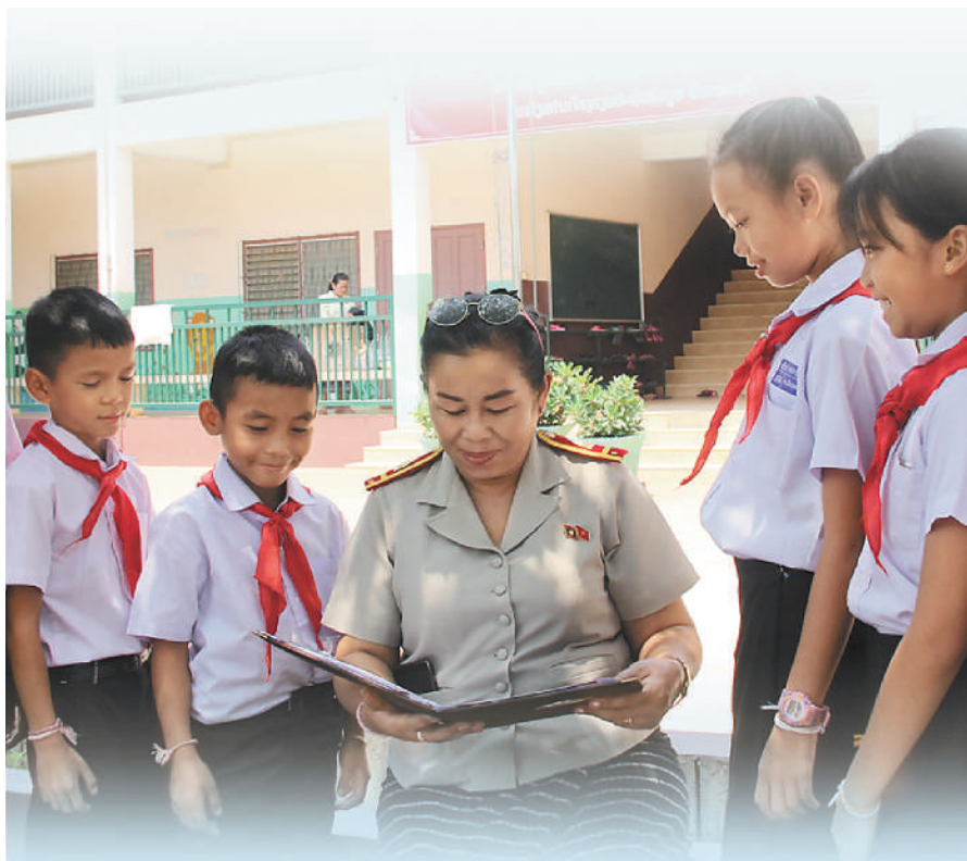
图①:2019年4月30日,中老友好农冰村小学的师生在诵读习近平主席的回信。