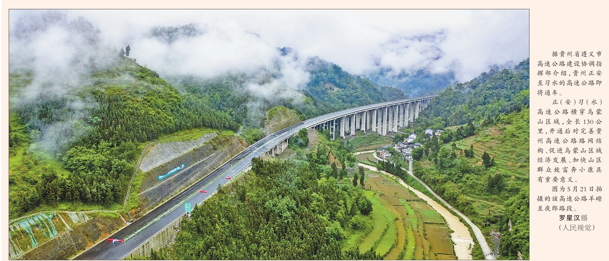
据贵州省遵义市高速公路建设协调指挥部介绍,贵州正安至习水的高速公路即将通车。正(安)习(水)高速公路横穿乌蒙山区域,全长130公里...