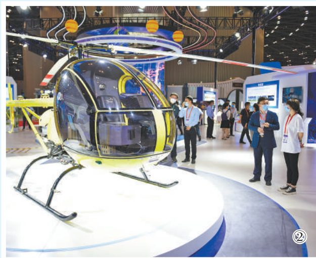
图①:第十二届中国中部投资贸易博览会现场。资料图片 图②:第十二届中国中部投资贸易博览会上展出的JH-5小白虎无人驾驶直升机。张文波摄