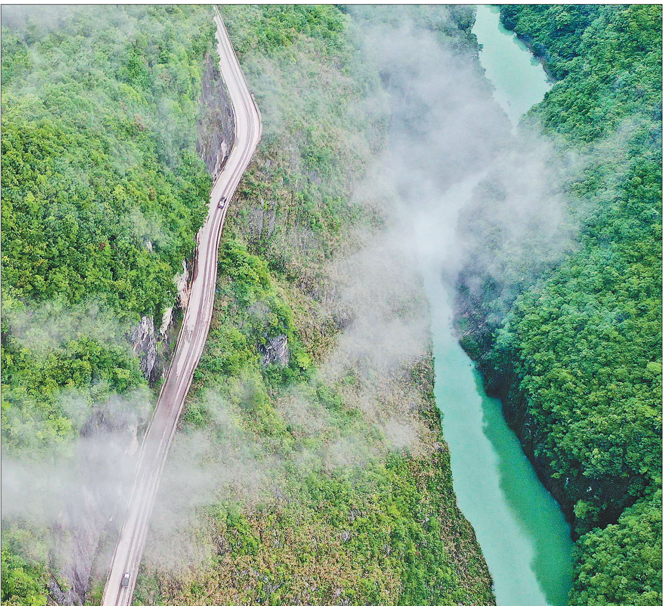
5月20日,汽车行驶在湖北省恩施土家族苗族自治州鹤峰县雕崖挂壁公路上。雕崖挂壁公路全长约3公里,是巴鹤(巴东至鹤峰县)公路中的一段。这里峡谷高深、碧水深潭、绝壁对峙,是当地群众出行、农产品出山的必经之路。