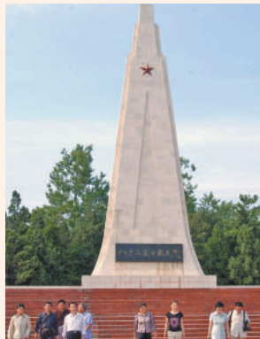
这是位于江苏省淮安市淮阴区的八十二烈士陵园。