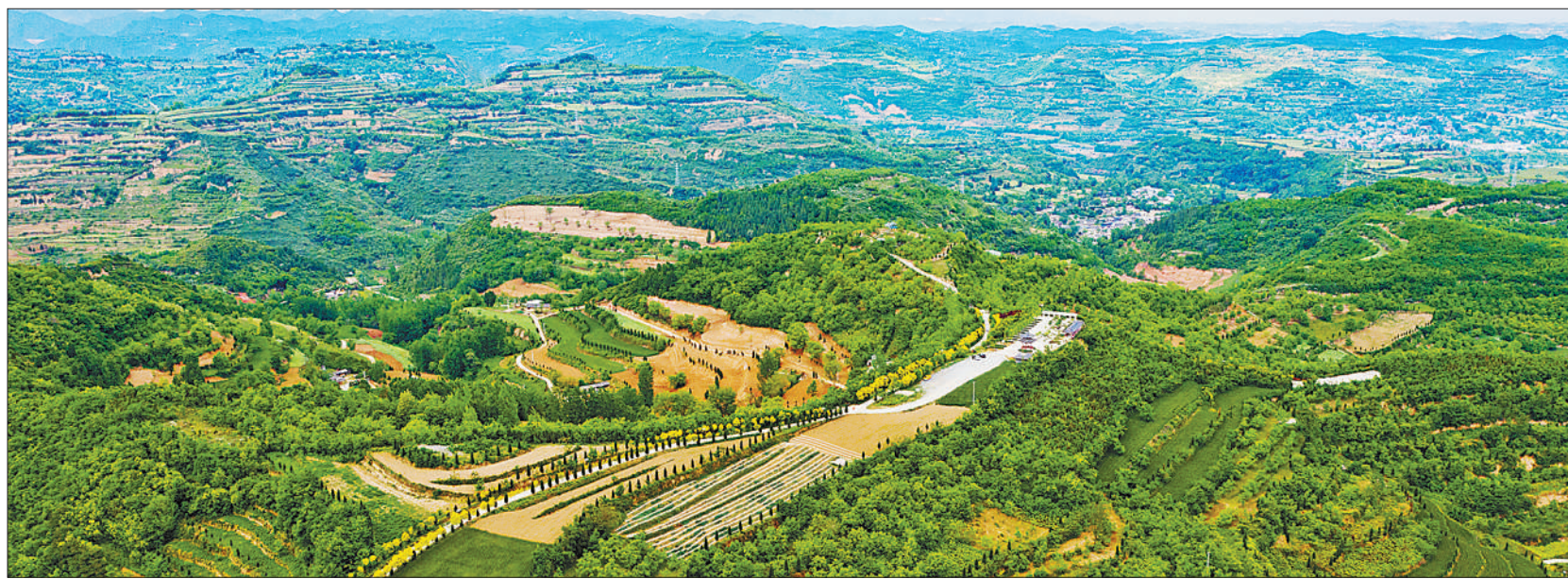
近年来,甘肃省陇南市成县坚持生态优先、绿色发展,统筹推进,系统治理,全县森林覆盖率达到了47.9%,先后打造了14个省域美丽乡村。