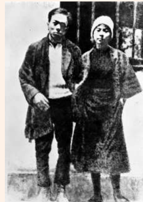
周文雍和陈铁军临刑前的留影。