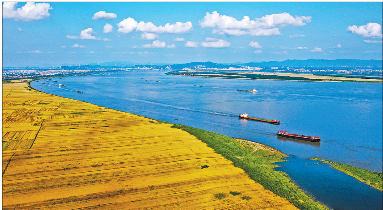
5月9日，安徽省安庆市宿松县复兴镇长江两岸，麦浪飘香，风景如画。位于长江北岸的省属农垦华阳河农场中，3万亩小麦日渐成熟，即将收割。

史学习教育领导小组办公室请专家结合读者要求梳理了130余问题，于4月9日在“学习强国”学习平台发布，引起热烈反响。4月21日起，党史学习教育领导小组办公室请中央党史和文献研究院、中央党校（国家行政学院）、中国社会科学院、中国人民大学、天津大学等单位24位党史专家进行在线问答交流。广大网友踊跃参与、争相提问、跟帖留言、