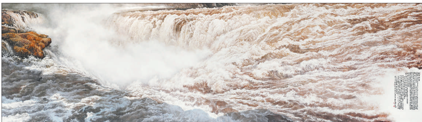
▼黄河朝晖(中国画) 冯大中

抗争的巨人形象。昂首呐喊的巨人,身躯与手臂虽然被捆绑,却如一头苏醒的睡狮,展现出不可遏制的爆发力。艺术家以象征的手法,表现出中华民族历经磨难而不屈的精神。