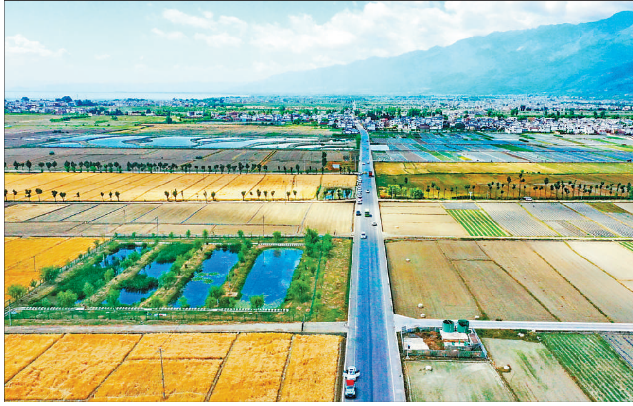
云南省喜洲镇因地制宜,引导农民种植绿色、有机农作物的同时,大力发展乡村休闲旅游产业,打造集农耕文化、乡村旅游等为一体的田园综合体项目,拓展农业产业链价值链。 图为喜洲镇和乐村田野如画,美景怡人。