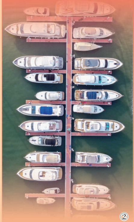
图②:停靠在海南三亚某码头的游船。