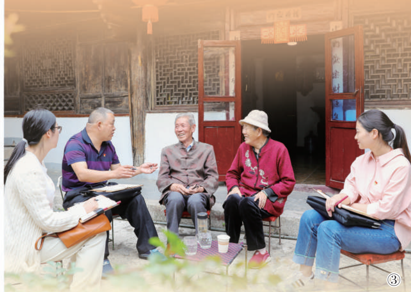
图③:云南陆良县干部在马街镇全村家访。