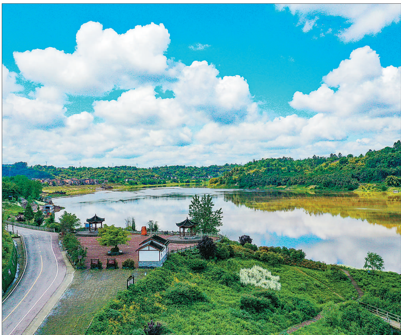
4月26日,四川华莹市明月镇明月村,一场春雨后,利用渠江滩涂兴建的生态公园更显清新美丽。

“中国有丰富、高质量的劳动力资源,有完善的产业配套能力,有超大规模市场优势。”屠新泉表示,只要各地各部门继续加大政策支持力度、加快政策落实落地,企业苦练内功、危中寻机,就能克服各种艰难险阻,促进外贸外资稳中提质,为构建新发展格局、推动中国经济高质量发展做出更大贡献。