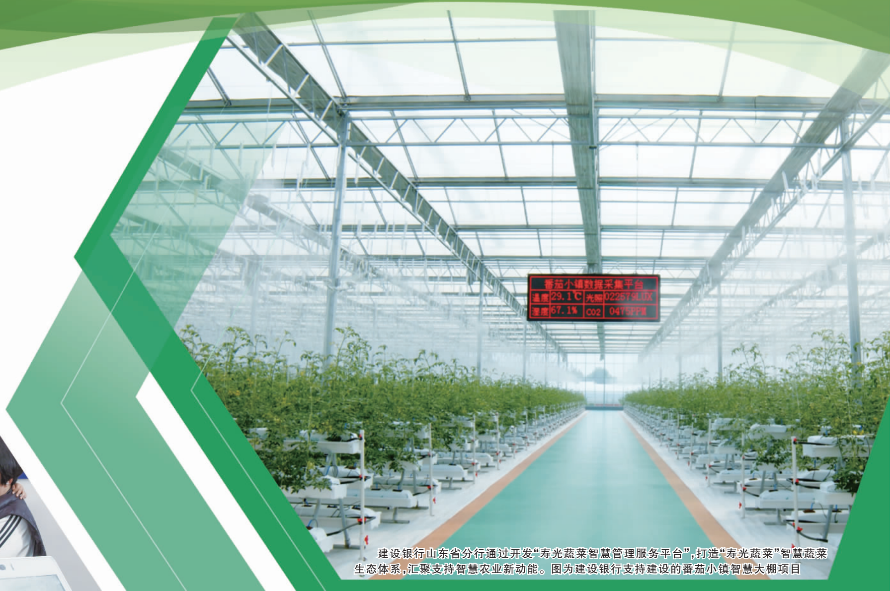
寿光小鎮智慧管理服务平台 温度: 29.1℃ 光照: 022579.0lx 湿度: 67.1% CO2: 04152ppm