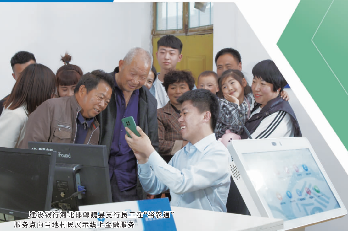
建设银行河北邯郸魏县支行员工在“裕农通”服务点向当地村民展示线上金融服务