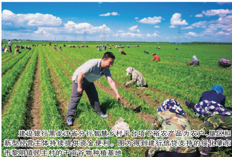
建设银行黑龙江省分行智慧乡村平台项下裕农产品为农户、垦区和新型经营主体持续提供资金便利。图为得到建行信贷支持的绥化肇东市黎明镇民主村的平原谷物种植基地