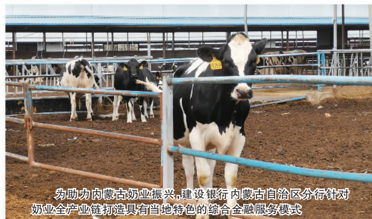
为助力内蒙古奶业振兴，建设银行内蒙古自治区分行针对奶业全产业链打造具有当地特色的综合金融服务模式

面对农村融资难题，建设银行内蒙古自治区分行创新设计系统内首个生物资产抵押贷款产品，帮助中小养殖场解决改造升级资金问题；建设银行江苏省分行聚力创新，打造“裕农富苏”特色品牌，整合行内线上经营平台和外部涉农服务平台，丰富民生场景覆盖，探索打造乡村振兴G端赋能样板；依托广西柳州市茉莉花资源，建设银行广西壮族自治区分行搭建“一朵云、一平台、一终端、四系统”数字综合平台，以新金融构建“数字茉莉”新业态，推动业务拓新路、开新局，助力柳州市实现茉莉花综合产值超百亿元。