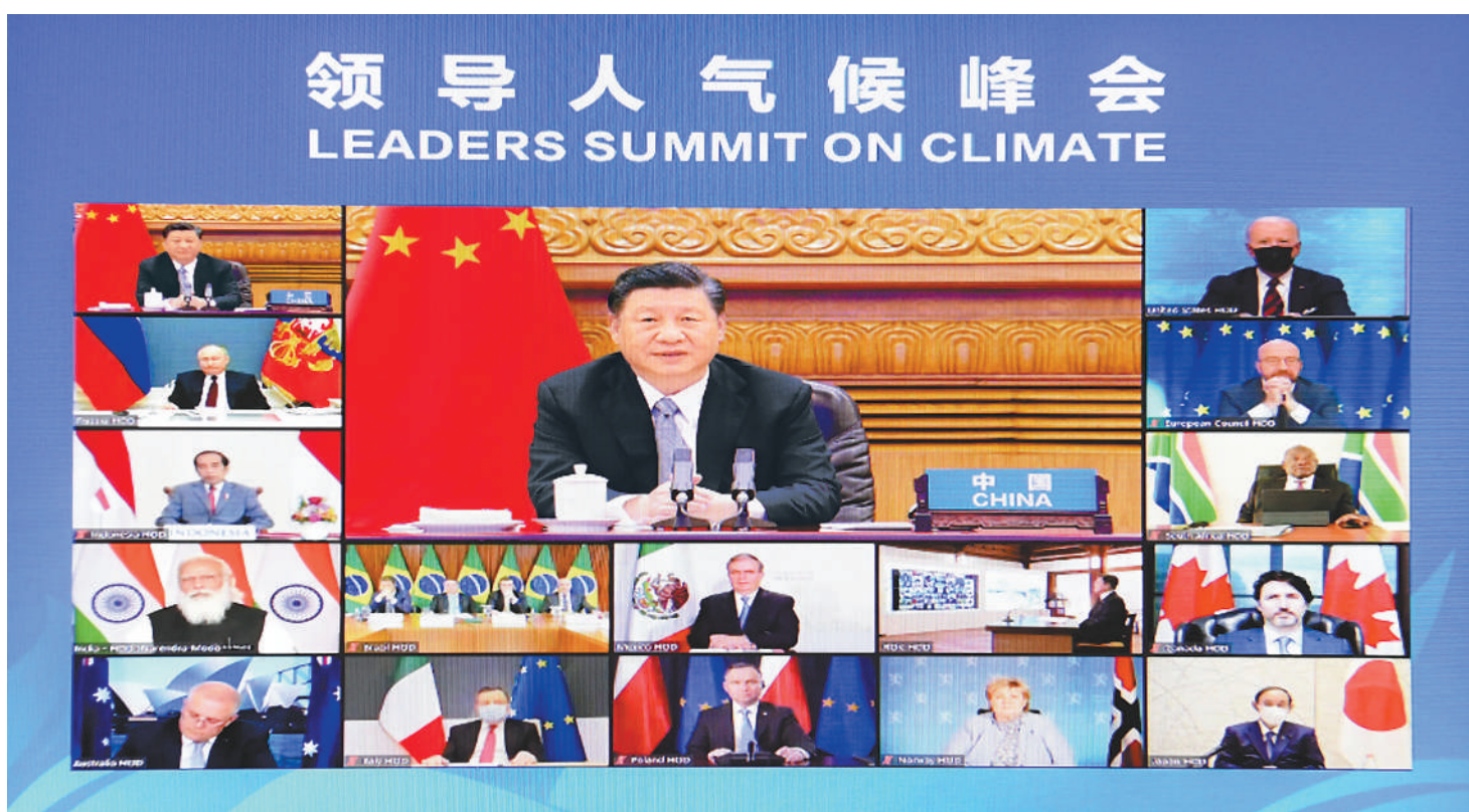
4月22日晚,应美国总统拜登邀请,国家主席习近平在北京以视频方式出席领导人气候峰会,并发表题为《共同构建人与自然生命共同体》的重要讲话。