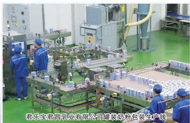
君乐宝君昌乳业有限公司罐装奶粉包装生产线