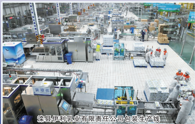
滦县伊利乳业有限责任公司包装生产线