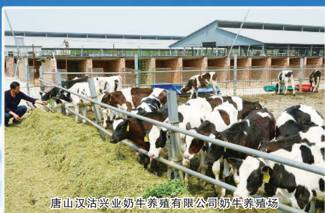
唐山汉沽兴业奶牛养殖有限公司奶牛养殖场