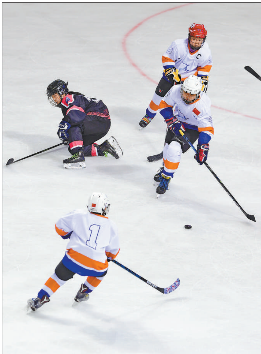
4月17日至19日，2021年全国青少年U14(14岁以下)冰球邀请赛在内蒙古呼和浩特举行，来自北京、天津以及内蒙古等地的6支青少年冰球队参加比赛。图为4月17日，参赛小球员在比赛中拼抢。