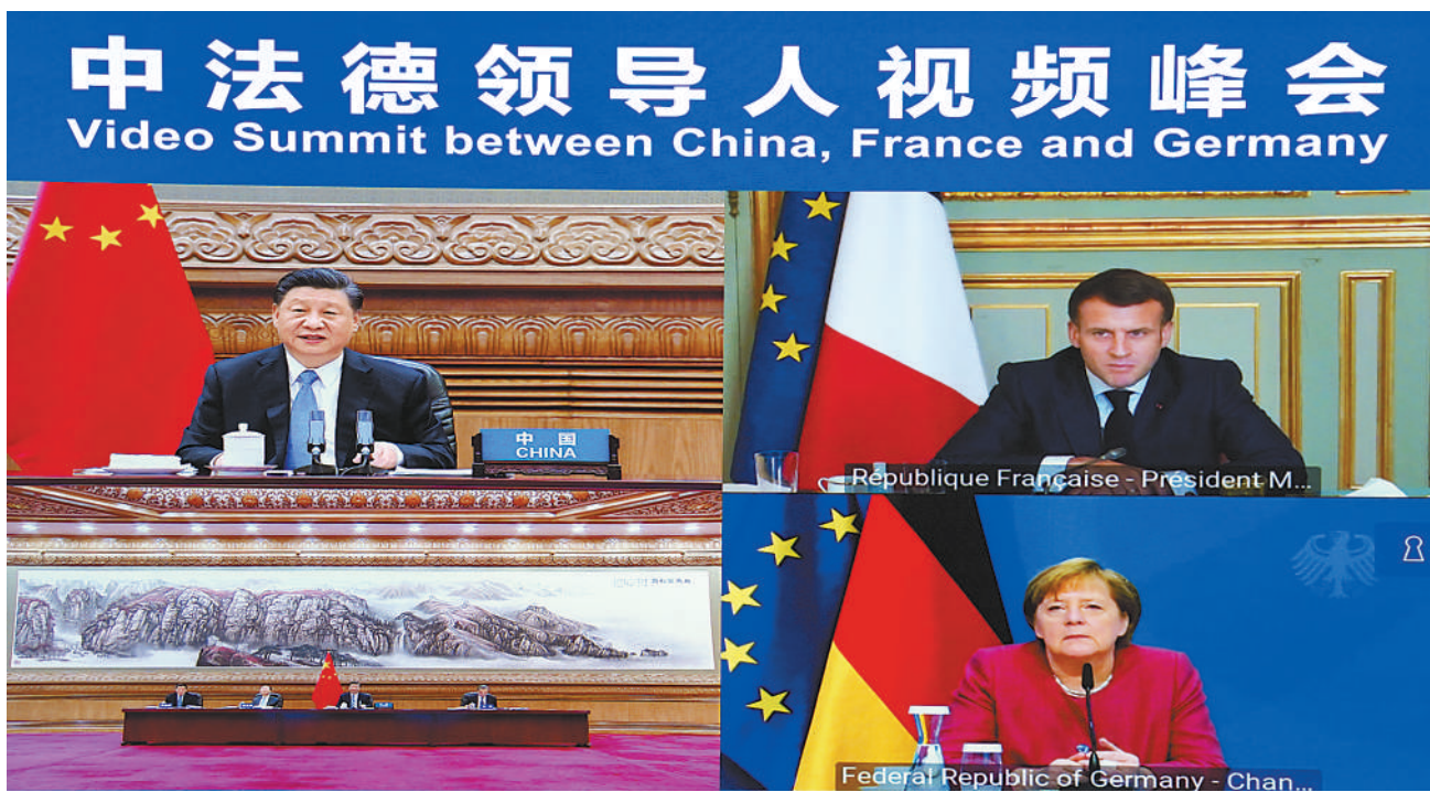
4月16日下午,国家主席习近平在北京同法国总统马克龙、德国总理默克尔举行中法德领导人视频峰会。

新华社北京4月16日电 4月16日下午,国家主席习近平在北京同法国总统马克龙、德国总理默克尔举行中法德领导人视频峰会。三国领导人就合作应对气候变化、中欧关系、抗疫合作以及重大国际和地区问题深入交换意见。 习近平强调,我一直主张构建人类命运共同体,愿就应对气候变化同法德加强合作。我宣布中国将力争于2030年前实现二氧化碳排放达到峰值、2060年前实现碳中和,这意味着中国作为世界上最大的发展中国家,将完成全球最高碳排放强度降幅,用全球历史上最短的时间实现从碳达峰到碳中和。这无疑将是一场硬仗。中方言必行,行必果,我们将碳达峰、碳中和纳入生态文明建设整体布局,全面推行绿色低碳循环经济发展。中国已决定接受《蒙特利尔议定书》基加利修正案,加强氢氟碳化物等非二氧化碳温室气体管控。应对气候变化是全人类的共同事业,不应该成为地缘政治的筹码,攻击他国的靶子、贸易壁垒的借口。中方将坚持公平、共同但有区别的责任、各自能力原则,推动落实《联合国气候变化框架公约》及其《巴黎协定》,积极开展气候变化南南合作。希望发达经济体在减排行动上作出表率,并带头兑现气候资金出资承诺,为发展中国家应对气候变化提供充足的技术、能力建设等方面支持。 习近平指出,当前,新冠肺炎疫情仍在全球蔓延,世界经济复苏任务十分艰巨。中欧关系面临新的发展机遇,也面临各种挑战。要从战略高度牢牢把握中欧关系发展大方向和主基调。中方将扩大高水平对外开放,为包括法、德企业在内的外商投资企业营造公平、公正、非歧视的营商环境,希望欧方也能以这样的积极态度对待中国企业,同中方一道做大做强中欧绿色、数字伙伴关系,加强抗疫等领域合作。中方反对“疫苗民族主义”,反对人为制造免疫鸿沟,愿同包括法、德在内的国际社会一道,支持和帮助发展中国家及时获得疫苗。中方愿同国际奥委会合作,向准备参加奥运会的运动员提供疫苗。 马克龙表示,法方欢迎中方宣布力争于2060年前实现碳中和,这一重大承诺体现了中方主动承担重要责任。法方愿同中方一道,推进法中、欧中经济关系进一步发展,携手帮助非洲实现绿色发展,并就帮助发展中国家减缓债务作出共同努力。疫苗不应成为大国竞争的工具,法方愿同中方就疫苗公平分配加强合作,就伊朗核等地区问题加强协调。 默克尔表示,德法中三国加强合作应对气候变化非常重要。中国宣布国家自主贡献目标既具雄心,也富挑战,对全球应对气候变化非常重要,欧方愿同中方加强政策沟通与对接。中国率先恢复经济增长对世界是好消息。德方重视中国实施“十四五”规划给德中、欧中合作带来的重要机遇,愿同中方深化互惠互利的经贸合作,就数字经济、网络安全等问题加强沟通,对各国企业一视同仁,避免贸易壁垒。希望双方共同努力,推动《中欧投资协定》尽快批准生效。 三国领导人一致认为,要坚持多边主义,全面落实《巴黎协定》,共同构建公平合理、合作共赢的全球气候治理体系,推动领导人气候峰会取得积极、平衡、务实成果;加强气候政策对话和绿色发展领域合作,将应对气候变化打造成中欧合作的重要支柱;统筹办好昆明《生物多样性公约》第十五次缔约方大会、格拉斯哥《联合国气候变化框架公约》第二十六次缔约方大会、马赛第七届世界自然保护大会等重要多边议程,打造全球环境治理新格局;支持“新冠肺炎疫苗实施计划”,促进人员健康安全有序往来,维护产业链供应链稳定,推动国际经贸合作早日恢复正常;支持发展中国家能源供给向高效、清洁、多元化方向发展。 杨洁篪、王毅、何立峰等参加会议。