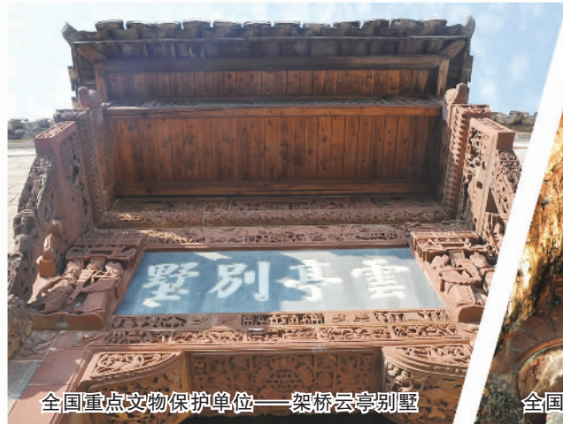
全国重点文物保护单位——架桥云亭别墅