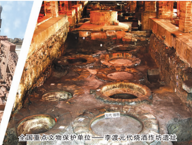
全国重点文物保护单位——李渡元代烧酒作坊遗址