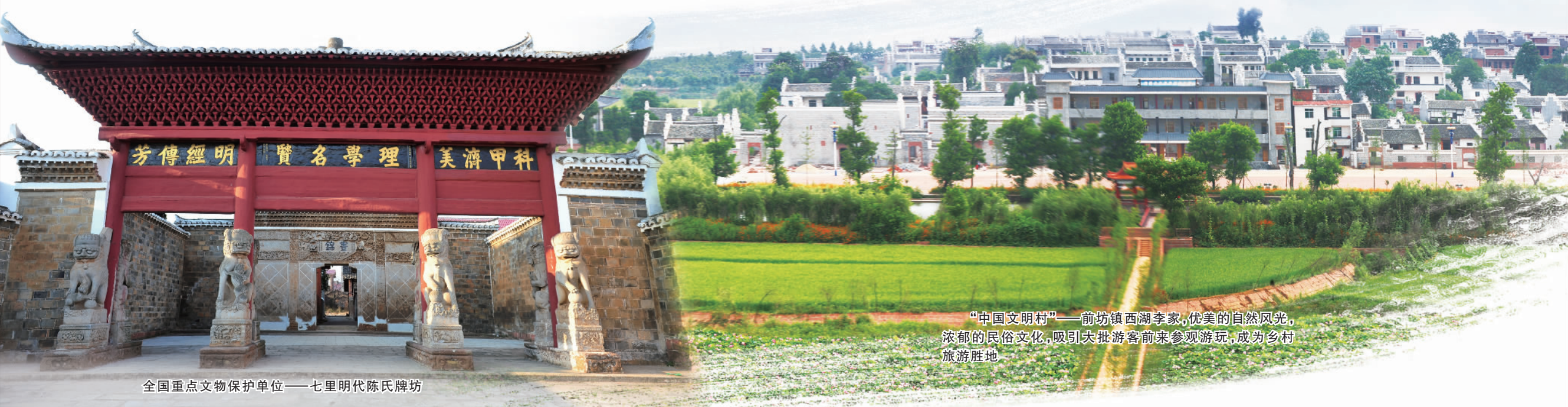
全国重点文物保护单位——七里明代陈氏牌坊