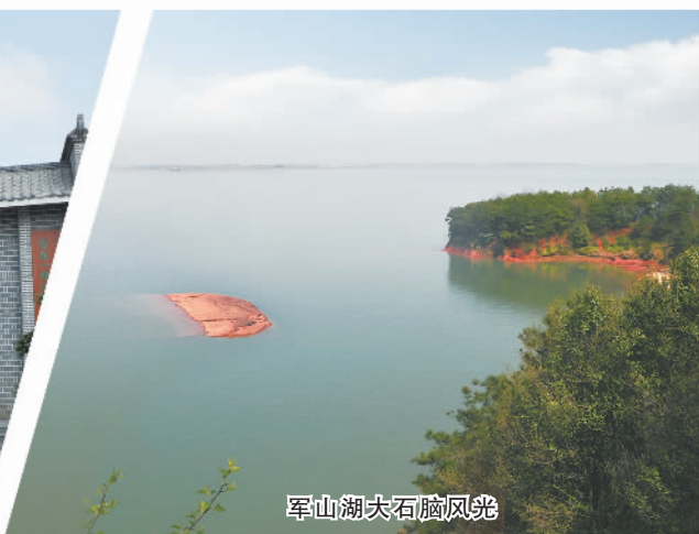
军山湖大石脑风光