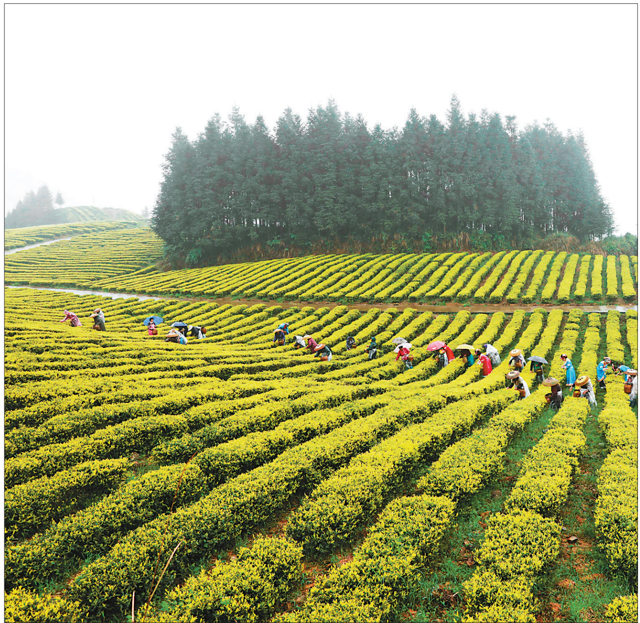
近年来,贵州省铜仁市江口县重点发展生态茶产业,采取“公司+基地+合作社+农户”模式,建成生态茶叶基地15万亩,发展茶叶企业百余家,带动近2万农户通过生态茶产业实现稳定增收,助力乡村振兴。图为4月10日,江口县桃映镇委会村农民在黄金芽茶叶种植基地采茶。