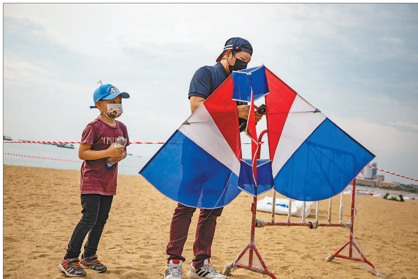
四月九日至十九日,二〇二二芭提雅海滩风筝节在泰国芭提雅海滩举行,预计将吸引众多游客参观并以此促进芭提雅旅游业恢复。图为四月九日,一名男子在芭提雅海滩准备放飞风筝。

“阿拉伯商业”网站指出,沙特政府期望通过扩大投资,促进国内私营部门增长,带动年轻人就业,推动经济重回正轨。分析指出,去年沙特非石油部门实现逆势增长,显示出经济韧性。未来随着疫苗普及和相关激励政策出台,沙特经济有望进一步释放活力。(本报开罗4月11日电)