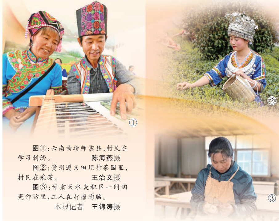
图①:云南曲靖师宗县,村民在学习刺绣。

近年来,五龙乡大力发展刺绣产业,成为远近闻名的旅游扶贫示范乡。“大家在一起,同吃同住好……”伴着踩脚踏布机和缝