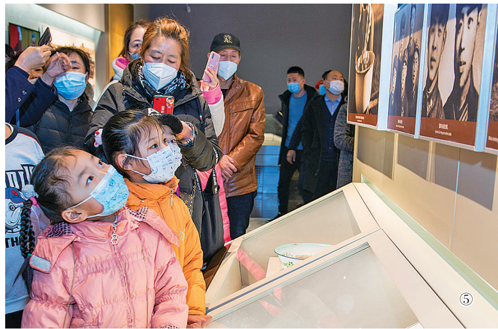
图①：雷锋同志照片。 图②：颁发给雷锋的少先队辅导员奖状。 图③：抚顺雷锋纪念馆。 图④：辽宁抚顺雷锋纪念馆雕塑。 图⑤：3月，重新修缮后的抚顺雷锋纪念馆开放，市民前来参观。