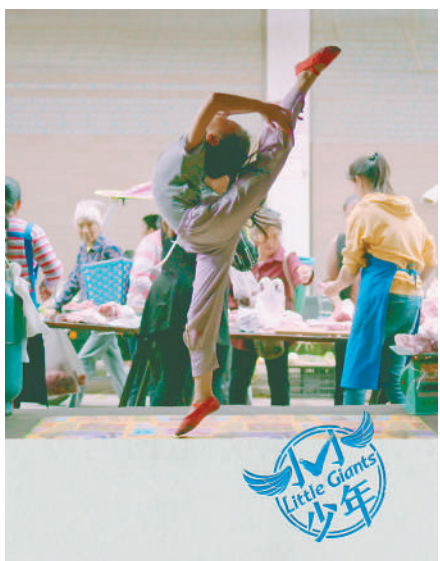
图为网络纪录片《小小少年》海报。