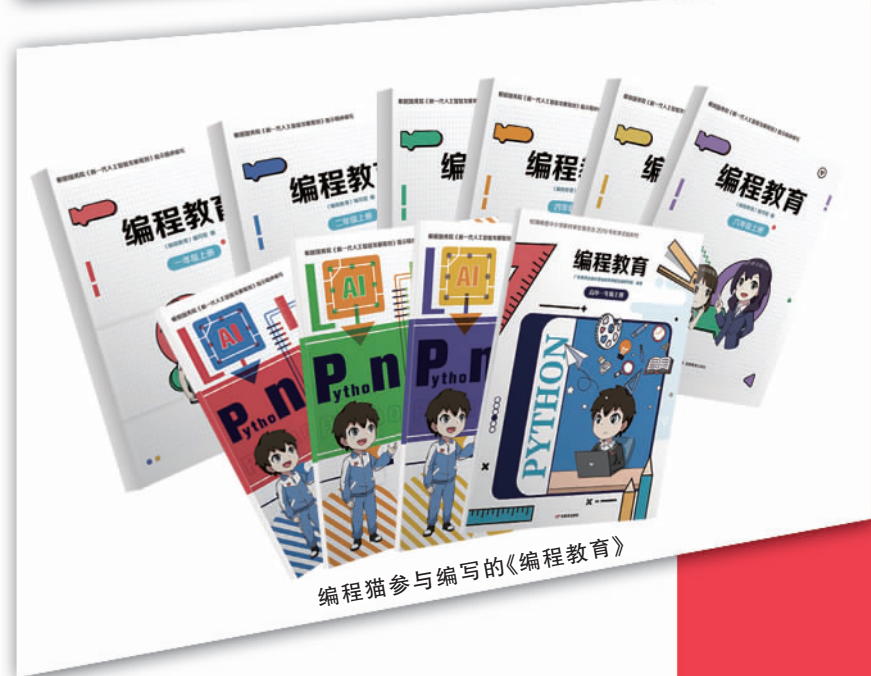
编程猫参与编写的《编程教育》