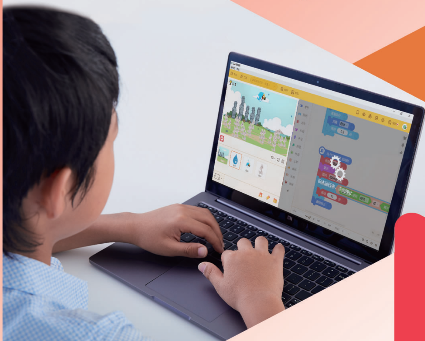
孩子使用编程猫工具创作作品