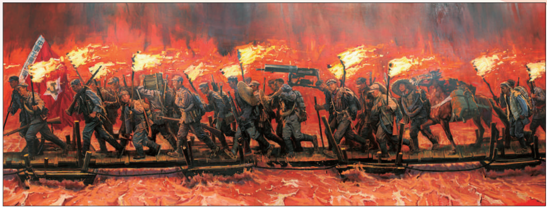
▲四渡赤水出奇兵(油画)