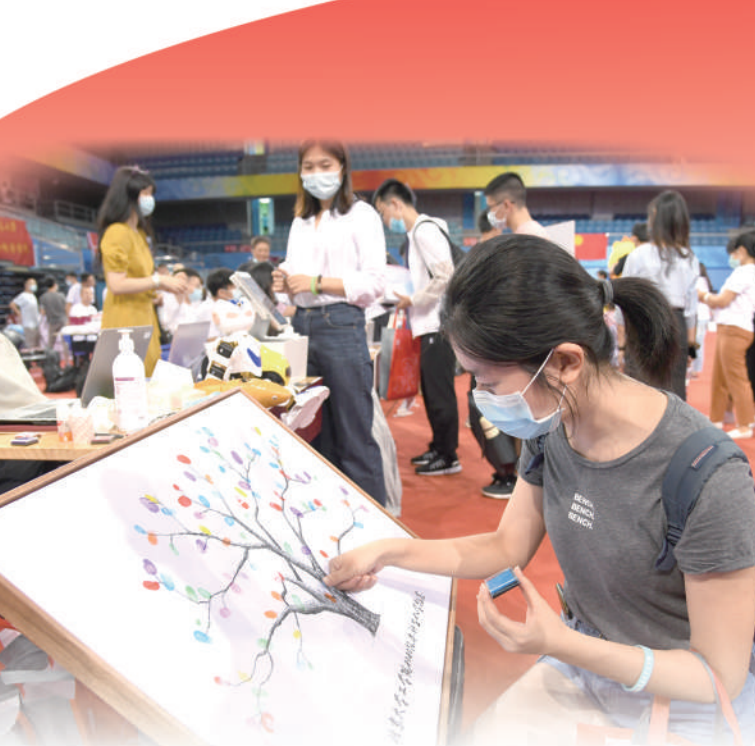
图①:哈尔滨工业大学超精密仪器技术创新团队。 图②:南京大学“985工程”——“物质科学平台”项目团队。 图③:2020年9月1日,一名北京大学新生在入学纪念画上按彩色手印。 图④:2020年9月9日,清华大学本科生开学典礼现场。