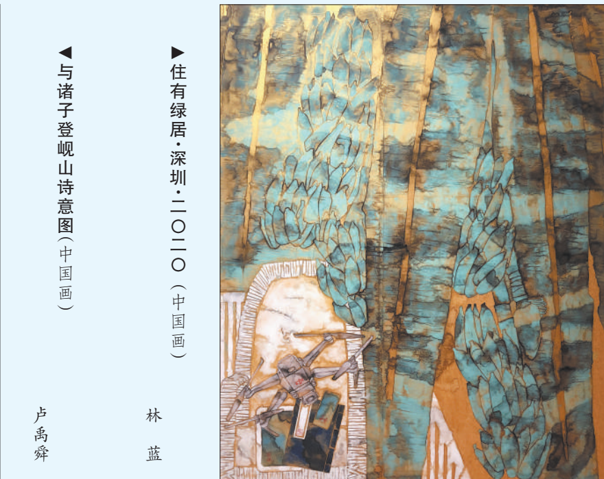
▶住有绿居·深圳·二〇二〇(中国画)