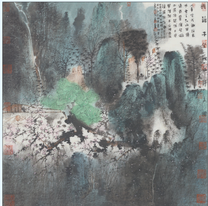
▲与诸子登岷山诗意图(中国画)