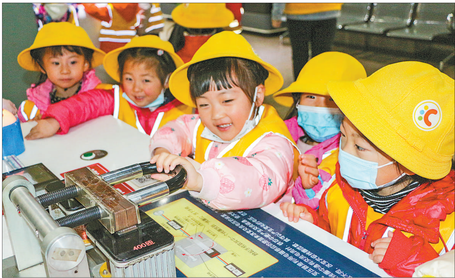
3月17日，河南省郑州市高新区幼儿园将课堂搬到科技馆，组织小朋友们零距离感受科技魅力，激发孩子们学科学、用科学、爱科学的意识，从而提升孩子们的科学素养。

会议指出，要深入学习贯彻习近平总书记重要讲话精神，精准把握政治巡视定位，突出“两个维护”根本任务，督促被巡视企业党委提