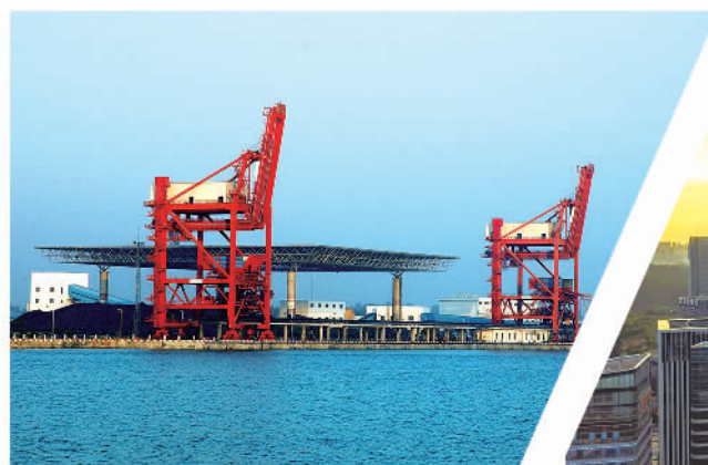
广投集团落实党中央赋予广西“三大定位”新使命,力引“央企入桂”合作建设一批龙头项目。图为与国电投公司共同出资建设的北海临港循环经济产业园