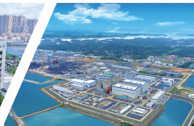
广投集团与中广核共同出资建设的广西防城港核电基地,是我国在西部地区开工建设的首个核电项目。图为广西防城港核电一期项目