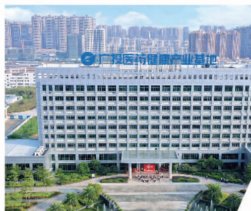
广投集团谋划布局医药健康产业,打造医药健康龙头企业,着力补齐广西医药健康产业链条。图为广投医药健康产业基地

为加快推进广投集团各板块建设,推动广投集团“十四五”高质量发展,现公开招聘广投集团总部及所属企业高层次管理人才,诚邀海内外英才共创未来。