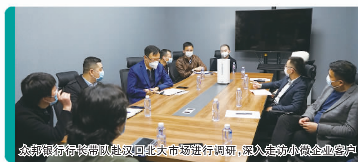
众邦银行行长带队赴汉回北大市场进行调研,深入走访小微企业客户

2020年10月,众邦银行与武汉“汉融通”平台合作推出“众商贷”汉融通301模式贷款产品,主要为缓解小微企业贷款难题,增强民营市场主体流动性,降低小微企业融资成本。2021年1月12日,在众邦银行