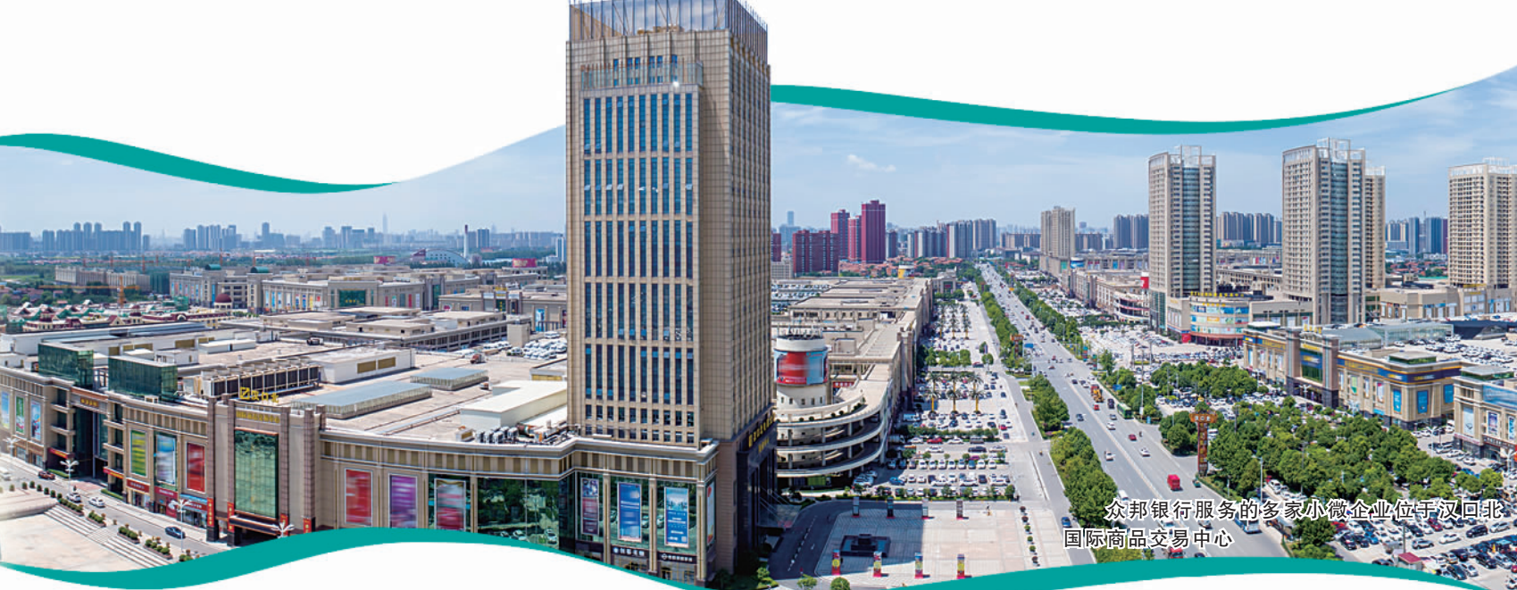
众邦银行服务的多家小微企业位于汉回北国际商品交易中心