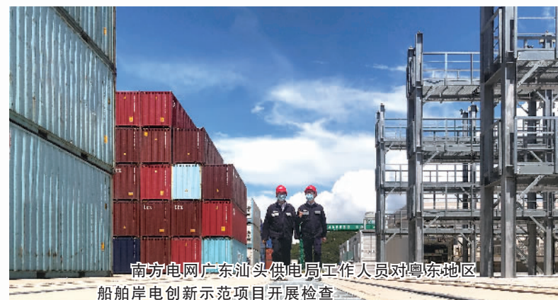
南方电网广东汕头供电局工作人员对粤东地区船舶岸电创新示范项目开展检查

电能替代是实现“碳达峰、碳中和”目标的重要途径,南方电网在港口岸电、电磁厨房、电动汽车充电技术等领域重点推进电能替代业务,引导消费者