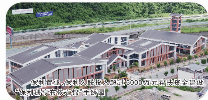
保利置业、保利久联投入超过5000万元帮扶资金建设“保利册亨布依之锦”手绣园