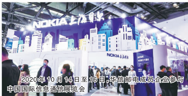
2020年10月14日至16日，华信邮电成员企业参与中国国际信息通信展览会