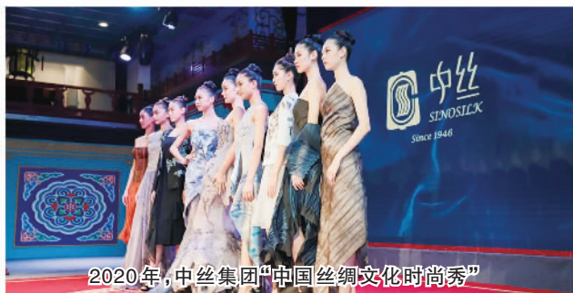
2020年，中丝集团“中国丝绸文化时尚秀”

保利集团多项主业处于行业排头兵地位，努力成为人民美好生活的创造者、贡献者和服务者。国际贸易业务连续多年位居国内行业前列，连续7次被上级主管单位评为“出口先进单位”。房地产业务销售签约额位列国内前五，保利发展连续11年获得“中国房地产行业领导公司品牌”称号。轻工业业务拥有日用化工、食品发酵、制浆造纸、皮革制鞋行业四家国家级研究院，主导制订了15项国际标准。工艺业务，中国工艺集团有限公司连续多年位列“中国工艺美术行业综合实力第一名”。保利文化获多项殊荣，演出与剧院管理、艺术品经营与拍卖两项业务居行业领先。