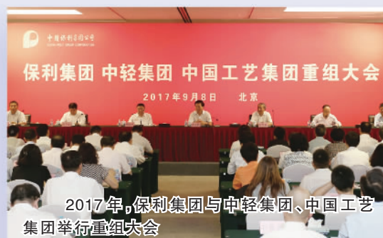
保利集团 中轻集团 中国工艺集团重组大会

保利集团以年度发展改革任务为抓手，推动重点改革任务落地。积极开展国有资本投资公司建设，优化国有资本布局。自2017年起，重组整合中轻集团、中国工艺集团、中丝集团、华信邮电四家央企，理顺上海诺基亚贝尔中方股权管理关系，增资广东长大。资本运作与资源配置能力逐步加强，新增2家上市公司。三项制度改革蹄疾步稳，员工价值创造能力不断增强。2020年，全员劳动生产率99.6万元/人，较“十三五”初增加60.4%。5年来，改革成绩明显，取得较大突破。