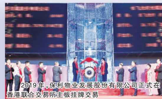
2019年，保利物业发展股份有限公司正式在香港联合交易所主板挂牌交易