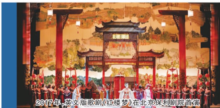
2017年，英文版歌剧《红楼梦》在北京保利剧院首演

保利集团多项主业处于行业排头兵地位，努力成为人民美好生活的创造者、贡献者和服务者。国际贸易业务连续多年位居国内行业前列，连续7次被上级主管单位评为“出口先进单位”。房地产业务销售签约额位列国内前五，保利发展连续11年获得“中国房地产行业领导公司品牌”称号。轻工业业务拥有日用化工、食品发酵、制浆造纸、皮革制鞋行业四家国家级研究院，主导制订了15项国际标准。工艺业务，中国工艺集团有限公司连续多年位列“中国工艺美术行业综合实力第一名”。保利文化获多项殊荣，演出与剧院管理、艺术品经营与拍卖两项业务居行业领先。