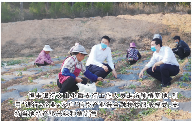
恒丰银行文山小微支行工作人员走访种植基地,利用“银行+企业+农户”信贷产业链金融扶贫服务模式,支持当地特产小米辣种植销售