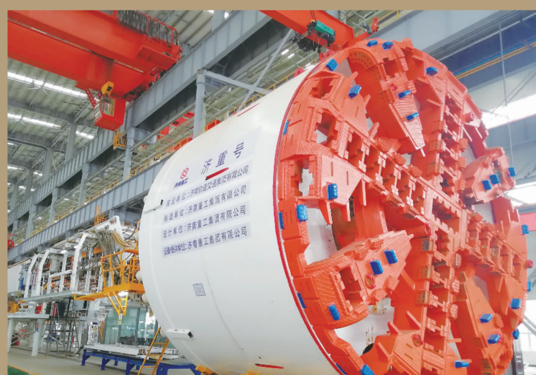
恒丰银行为济南重工集团有限公司的新技术研发提供资金支持,助力企业加快新旧动能转换