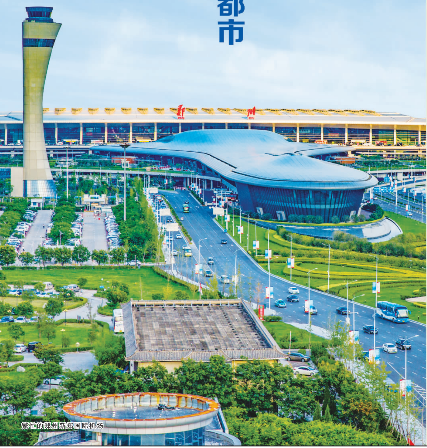
繁忙的郑州新郑国际机场