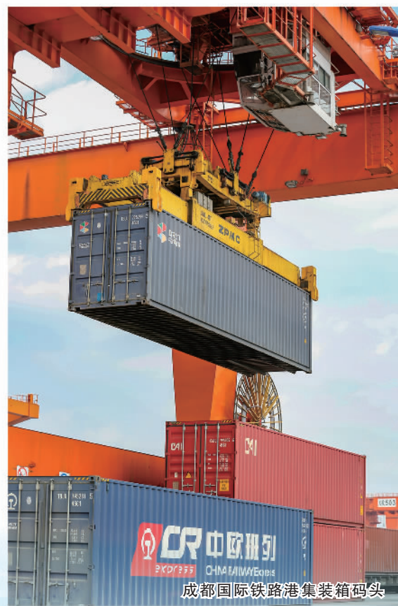
成都国际铁路港集装箱码头

欧班列),打通了成都与欧洲的陆路大通道。从此,成都、四川乃至西部地区的商流、物流、资金流、信息流源源不断汇集于青白江区,使其迅速成为成都市乃至四川省眺望世界的重要窗口。