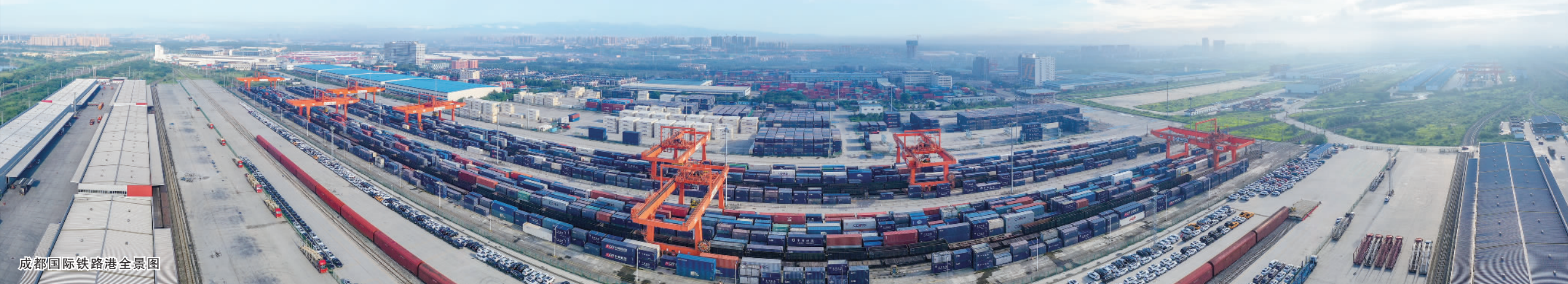
成都国际铁路港全景图