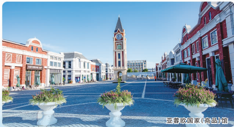
亚蓉欧国家(商品)馆