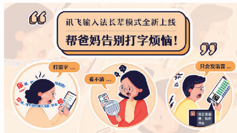
讯飞输入法上新长辈模式