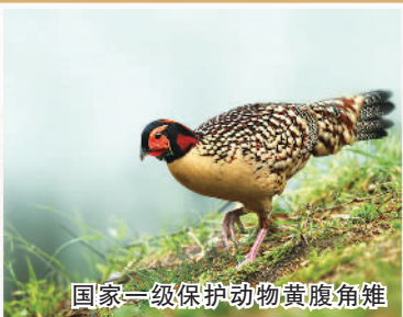
国家一级保护动物黄腹角雉