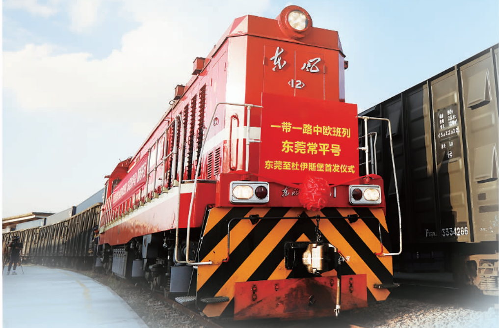
2020年11月18日，一带一路中欧班列东莞常平号（东莞至杜伊斯堡）正式发车