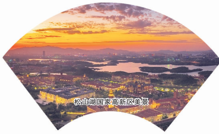
松山湖国家高新区美景

努力当好广东省地级市高质量发展领头羊。 “一百年”的历史交汇点上，东莞市坚持一张蓝图绘到底， 新发展理念，经济高质量发展迈出新步伐。站在“两个 以制造业立市的东莞，在“十三五”期间全面贯彻