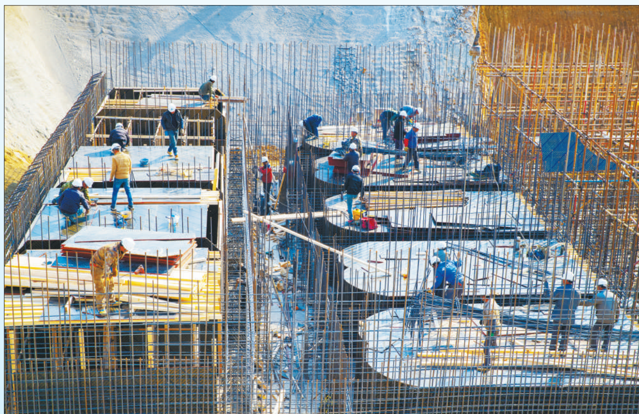
南水北调配套工程加快推进、大藤峡水利枢纽工程现场一片繁忙、西藏拉洛水利工程正式发电、重庆渝西水资源配置工程全线开工……各地重大工程的建设者争分夺秒、加紧施工。一批重大水利工程建设取得积极进展。2020年提出重点推进的150项重大水利工程清单，已开工45项；2020年全国共落实水利建设投资7695亿元，创历史新高。 重大水利工程是“两新一重”建设的重要内容，投资规模大、影响范围广、受益人口多，在强化水旱灾害防治、优化水资源配置、改善水生态环境等方面，具有不可替代的基础性作用。重大水利工程的加快建设，必将释放巨大的综合效益，治水兴水惠民生。 图①：2月7日，安徽省芜湖市繁昌区域域溪河排洪新站工程工地上，建设者在紧张施工。 图②：日前，引汉济渭工程渭河总干渠渡槽项目建设工地上，工人在忙碌地作业。 图③：2月9日，位于云南省巧家县和四川省宁南县交界处的白鹤滩水电站建设正稳步推进。这是目前世界在建规模最大的水电站。 图④：日前，引汉济渭工程秦岭输水隧洞挖掘现场，工人正在进行隧洞初步支护。 图⑤：日前，在浙江省缙云县方溪乡的缙云抽水蓄能电站施工现场，工人正在作业。 图⑥：2月23日，在江苏省宿迁市宿豫区峰山泵站建设工地，工作人员抢抓工期，紧张施工。