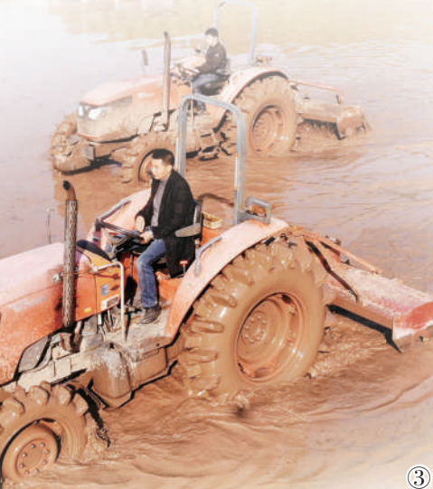
图③:2月19日,重庆忠县新立镇村民正在犁地。