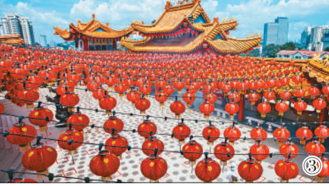
图①：泰国曼谷的购物中心被春节装饰点缀得喜气洋洋。 图②：日本横滨中华街举行“春节灯花”活动，张灯结彩迎来牛年新春佳节。 图③：马来西亚吉隆坡洋溢着春节气息。