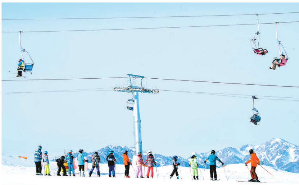
2月7日，滑雪爱好者在新疆丝绸之路国际滑雪场滑雪。