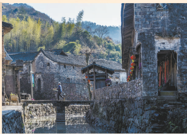
① 小桥流水。 ② 乡村生活。 ③ 劳作归家。

新华社北京2月4日电 (记者梅世雄)记者从国防部获悉：2月4日，中国在境内进行了一次陆基中段反导拦截技术试验，试验达到了预期目的。这一试验是防御性的，不针对任何国家。