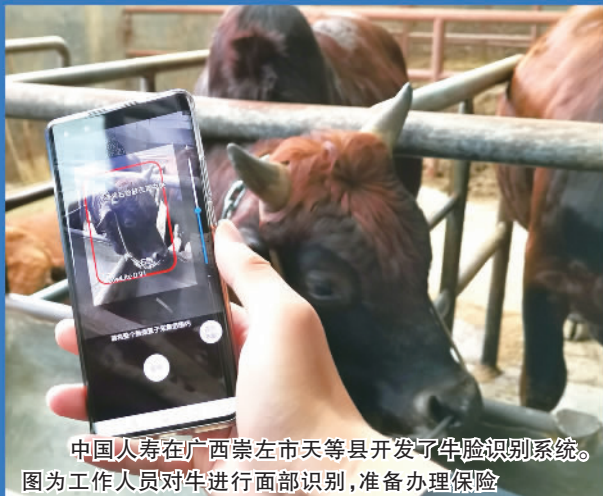
中国人寿在广西崇左市天等县开发了牛脸识别系统。图为工作人员对牛进行面部识别，准备办理保险。