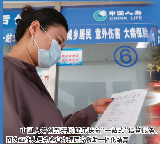
中国人寿创新开展健康扶贫“一站式”结算服务。图为工作人员为客户办理医疗救助一体化结算。