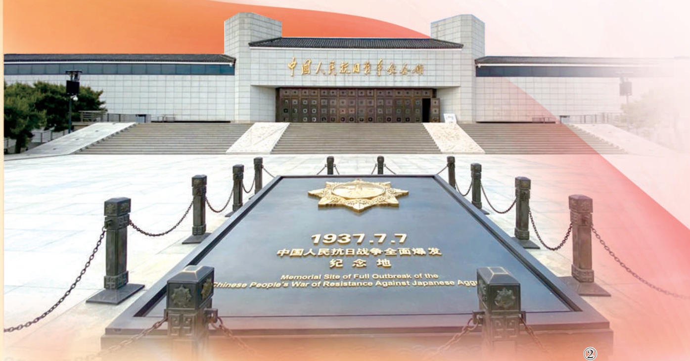
中国人民抗日战争纪念馆雄伟庄严,纪念馆前广场上,鲜艳的五星红旗高高飘扬,“独立自由勋章”雕塑格外醒目。