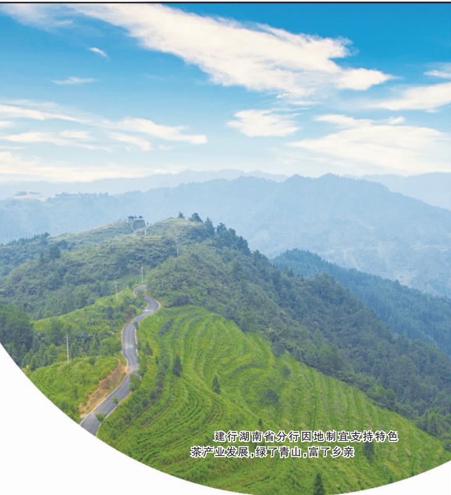
建行湖南省分行因地制宜支持特色茶产业发展,绿了青山,富了乡亲

建行湖南省分行积极发挥大行优势,整合第三方资源,与财政、公安、税务、电力、交通等13个厅局合作,搭