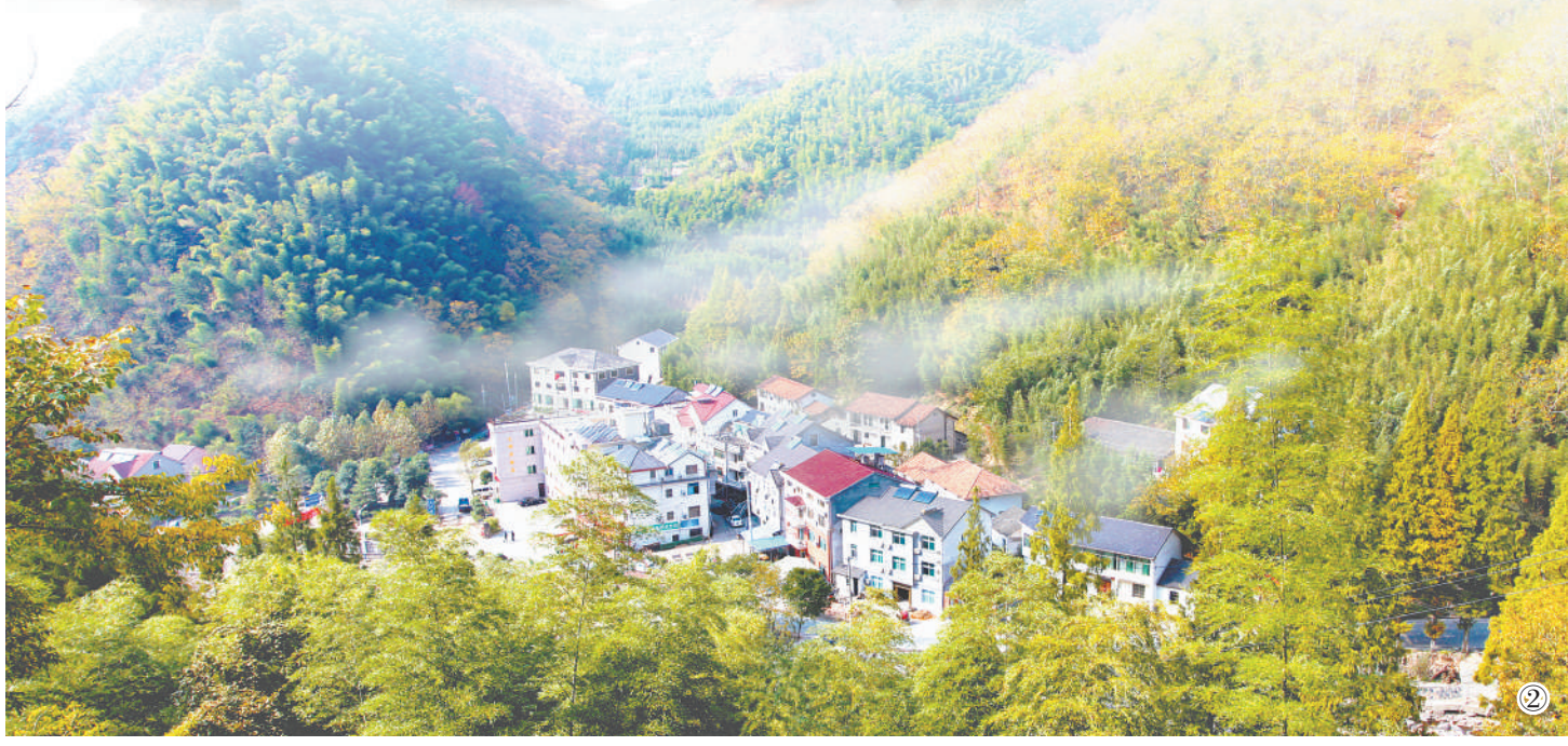
图②:白沙村村貌。 资料图片 版式设计:蔡华伟