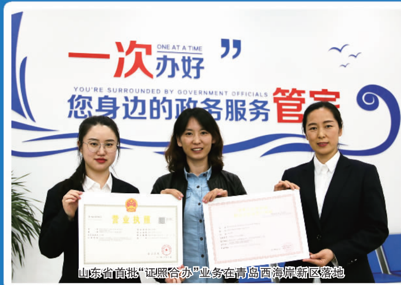
山东省首批“证照合一”业务在青岛西海岸新区落地