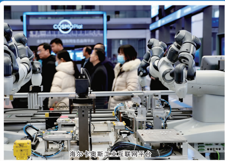
海尔卡奥斯工业互联网平台