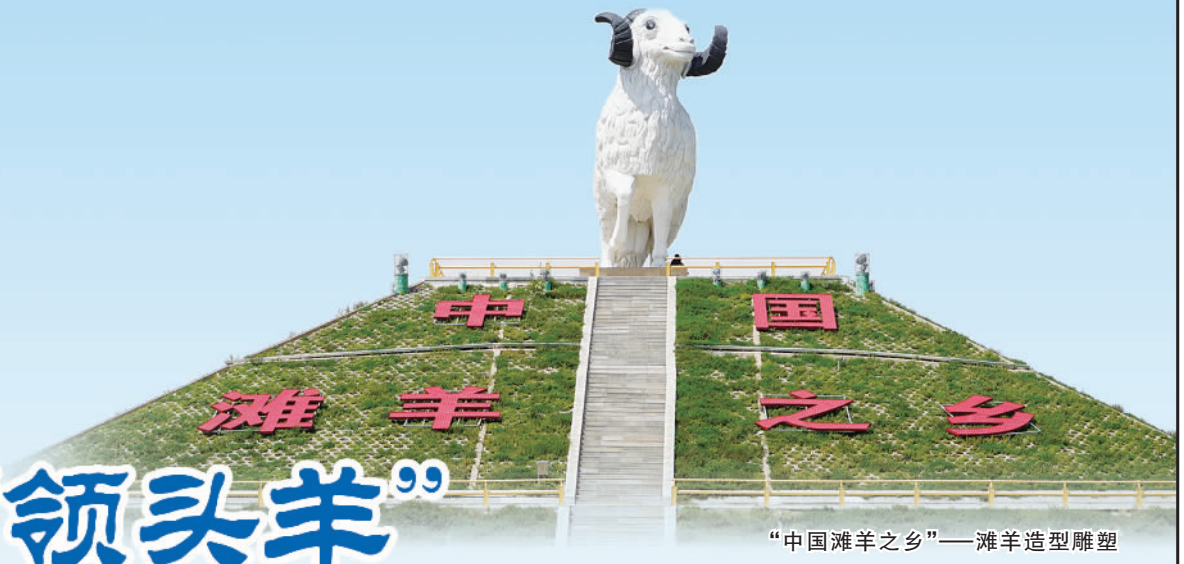
“中国滩羊之乡”——滩羊造型雕塑

盐池县位于宁夏回族自治区东部，地处陕甘宁蒙四省区七县交界地带，素以“西北门户、关中要冲”和“灵夏肘腋、环庆襟喉”而著称，是红色革命老区，也是中国北方半干旱农牧交错区266个牧区县之一，享有“中国滩羊之乡”“中国甘草之乡”等美誉。近年来，盐池县委、县政府立足资源禀赋，充分发挥“中国滩羊之乡”优势，秉持“打造一个品牌、造福一方百姓”的初心和梦想，全力打造“盐池滩羊”品牌。如今“盐池滩羊”已经成为盐池县农民脱贫致富的“铁杆庄稼”和农业农村发展的“一号”产业。