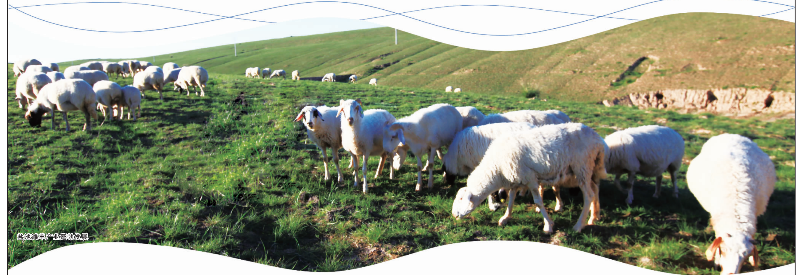
盐池滩羊产业蓬勃发展