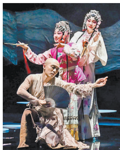
图为舞台节目《惊·鸿》剧照。